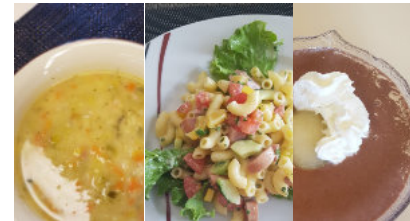
Menu - Vielfalt