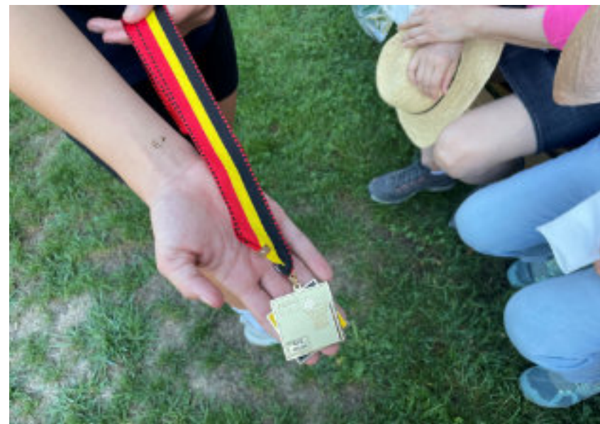
Die Jugendlichen der Korbballmannschaft des DTV Täuffelen zeigen uns ihre Medaillen.

Wir marschieren los. Der erste Halt ist im katholischen Zentrum. Wir bewundern zusammen mit der Künstlerin das Wandbild, welches den Kirchenraum ziert. Unter der Linde beim Schulhaus werden wir mit einer schönen Akkordeonmelodie empfangen. Gemeinsam singen wir das Lied vom alten Lindenbaum.